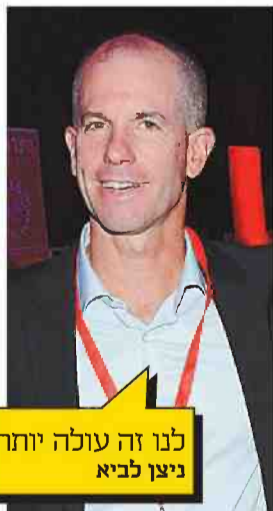
לנו זה עולה יותר ניצן לביא